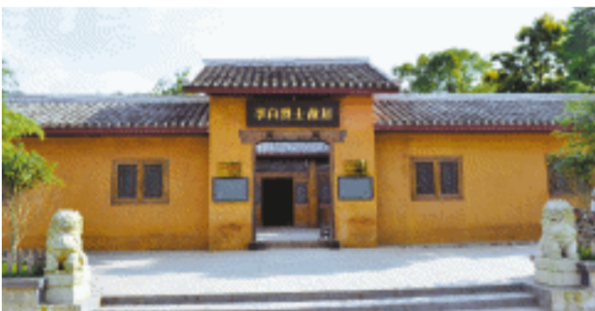
李白烈士故居