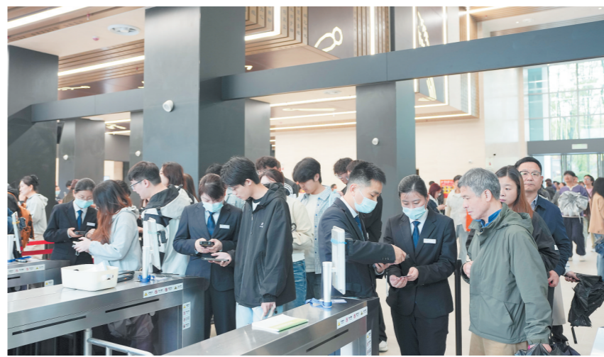
4月14日，省博物馆入馆新通道启用，游客从烈士公园西门进入，穿过全新亮相的融合广场，沿着指引，通过闸机，就可到达省博物馆。