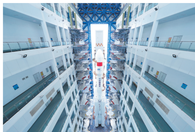
5月8日,天舟十号货运飞船与长征七号遥十一运载火箭组合体开始垂直转运。

此前,天舟九号货运飞船已于5月6日撤离空间站组合体,5月7日再入大气层。这意味着,中国空间站已经为天舟十号的到来腾出对接端口。